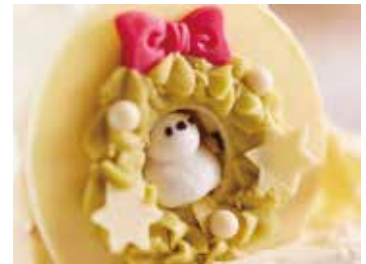
クリスマスリースから顔を覗かせているお茶目なシマエナガ。360度どこから見てもかわいいケーキで特別なクリスマス。