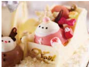
サンタクロースとトナカイが仲良くプレゼントを運んでいます。色とりどりのプレゼントボックスが真っ白なケーキに映えます。