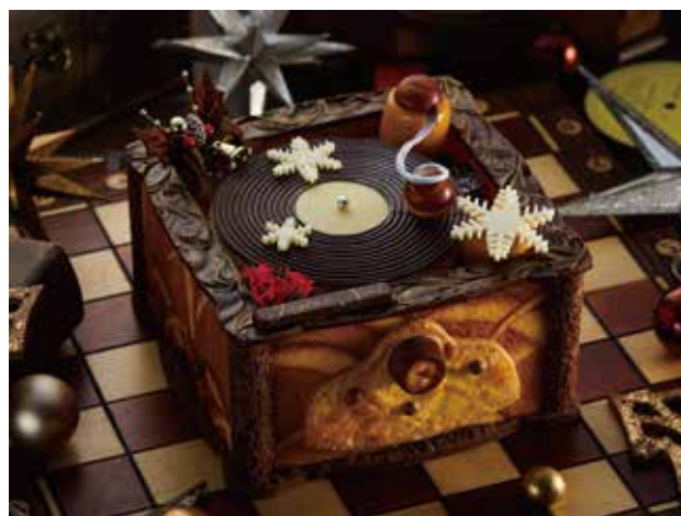
スヴェニール Souvenirs ～色褪せない記憶～

【限定 50 台】8,000 円(税込) 縦 13.5cm × 横 28.0cm × 高さ 8.5cm