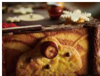
スポンジの様子はパティシエが手作業で付けており、ケーキ全体を華やかに引き立てます。