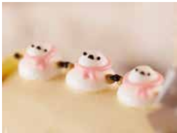
パティシエの手から生み出される雪の妖精は、表情も少しずつ違います。