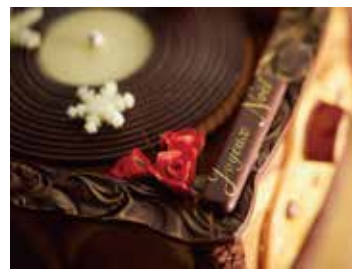
チョコレートの細かな装飾はチョコレート細工を得意とする料理長によるもの。