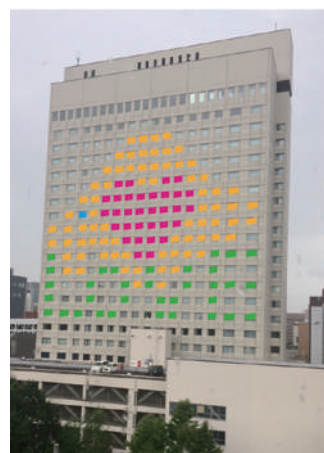
大原簿記情報専門学校様 8階から 見たイメージ(合成画像です)