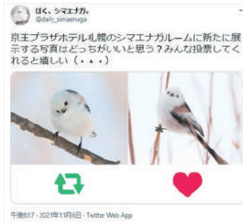
▲ファン投票の様子