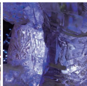
▲透明度の高い氷に反射する光