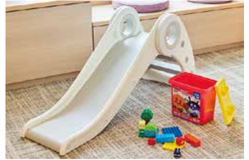
滑り台とブロック遊具