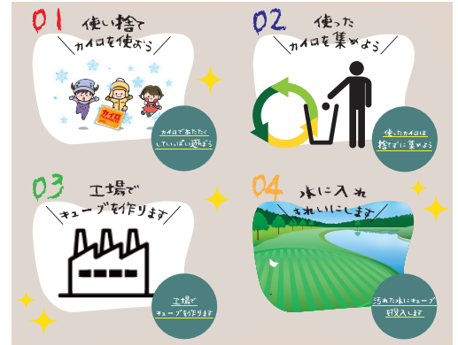
▶世界の水をキレイにする4ステップ

京王プラザホテル札幌では4月11日より1階ロビーに、キューブの原料となる使い捨てカイロの回収スポットを北海道で初めて設置し、お客様や地域の皆様から使用済みや有効期限切れのカイロを回収いたします。カイロから作られたキューブは海や川などの水域浄化に使われます。