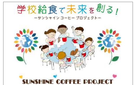
▶サンシャイン コーヒー プロジェクト

お客様に美味しいコーヒーを楽しんでいただくとともに「レッドカップキャンペーン」を知っていただき、支援の輪を広げてまいります。