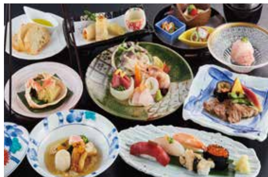
■ろばた・すし・北のめし〈あきず〉 料理長おすすめコース