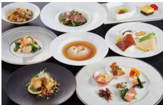
■中国料理〈南園〉 桃花コース