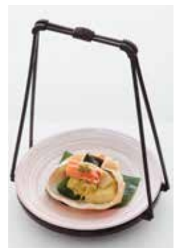
■特典：ズワイ蟹と筍の甲羅盛り ～落味噌ジュレ～