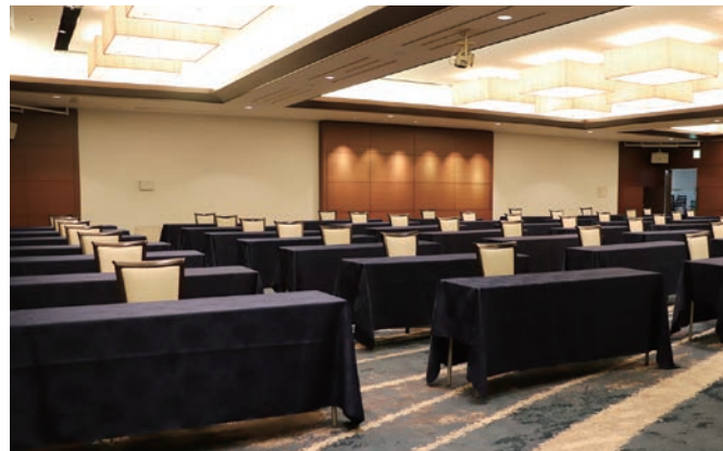
宴会場 310 m 2 約 50 名 会議・スクール形式 椅子間隔 横 2m