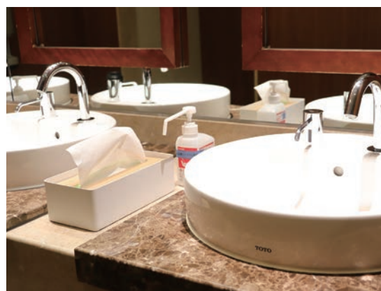
■化粧室 ハンドドライヤーの使用を中止し、 使い捨てペーパータオルを使用