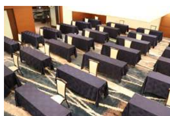
ソーシャルディスタンスを確保した宴会場