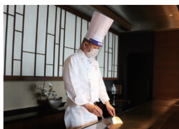
鉄板焼(やまなみ)調理スタッフ フェイスシールド装着