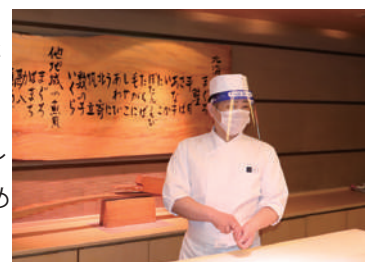
ろばた・すし・北のめし(あきず)調理スタッフ フェイスシールド装着

再開するレストランにおいては、安全性を考慮し、お客様どうしの間隔を確保するテーブルレイアウトが必要なことから広さ約575㎡天井高3mを優に超える最大200席を誇る当ホテルのメインレストランである1階〈グラスシーズンズ〉を再開いたします。〈グラスシーズンズ〉は本来ブッフェレストランとして営業しておりましたが、当面の間、ブッフェスタイルでの営業を休止し、業態を変更し洋軽食・和食が一緒に楽しめるレストランとして営業いたします。あわせて22階/鉄板焼〈やまなみ〉、地下1階/ろばた・すし・北のめし〈あきず〉においても席の間隔を確保するためにご利用人数の制限をおこない営業を再開いたします。またお客様と対面する調理スタッフにおいてはフェイスシールドを装着して飛まつ防止対策を講じます。その他、部署ごとに「新北海道スタイル安心宣言」にもとづいた感染拡大防止をおこいお客様をお迎えいたします。