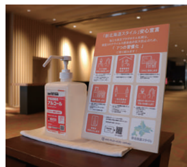
「新北海道スタイル」安心宣言パネルの設置