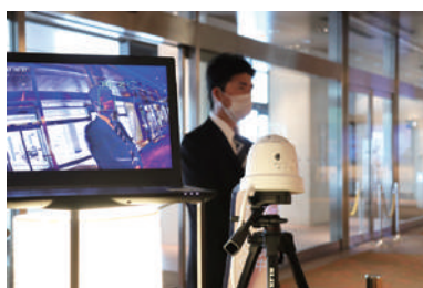
ロビーにサーモグラフィカメラ設置