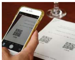
QRコード読み取りメニューの設置