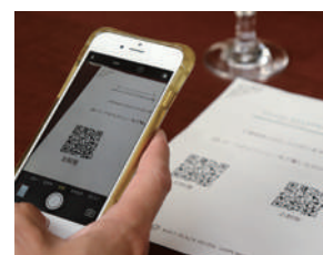
QRコード読み取りメニューの設置