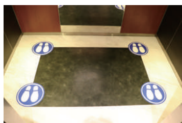
エレベーターの人数制限