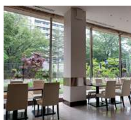
グラスシーズンズは開放的な大空間