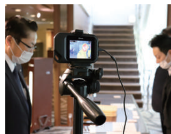
主催者様のご要望に応じてサーモグラフィカメラの手配を承ります。