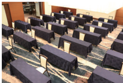
ソーシャルディスタンスを確保した宴会場