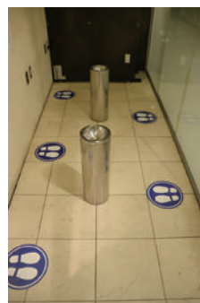
喫煙室の人数制限