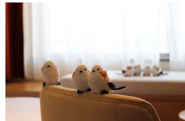
▲コンセプトルームイメージ