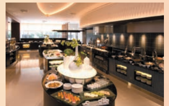
GLASS SEASONS ブッフェ&パーティコート Buffet & Party Court (グラスシーズنز)

22F | ※予約制となりますので、ご利用に 際しましては下記レストラン予約へ お問い合わせください。