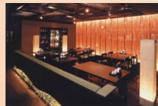
そばたすし 北のめし あきすず

B1 | [営業時間] (平日)11:30～15:00 17:00～21:30 (土・日・祝)11:30～21:30