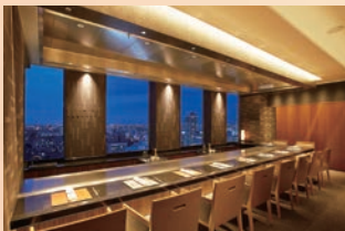
鉄板焼 やまなみ TEPPAN-YAKI YAMANAMI