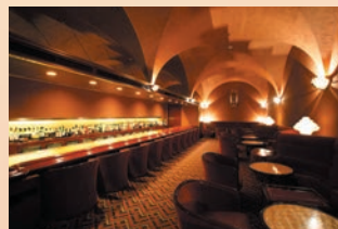
CROSS VAULT メインバー (クロスヴォールト)

1F | [営業時間] (月～土)17:00～1:00 (日・祝)17:00～23:00